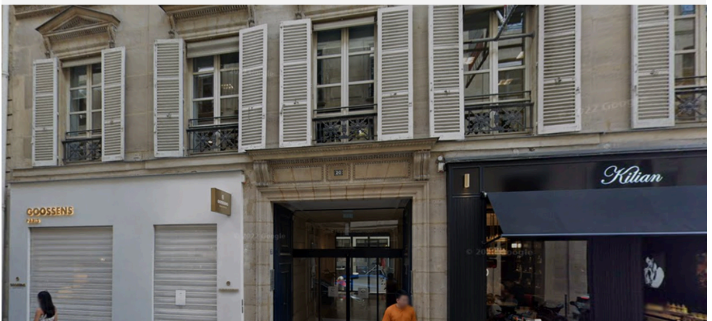
20, Rue Cambon - 75001 PARIS