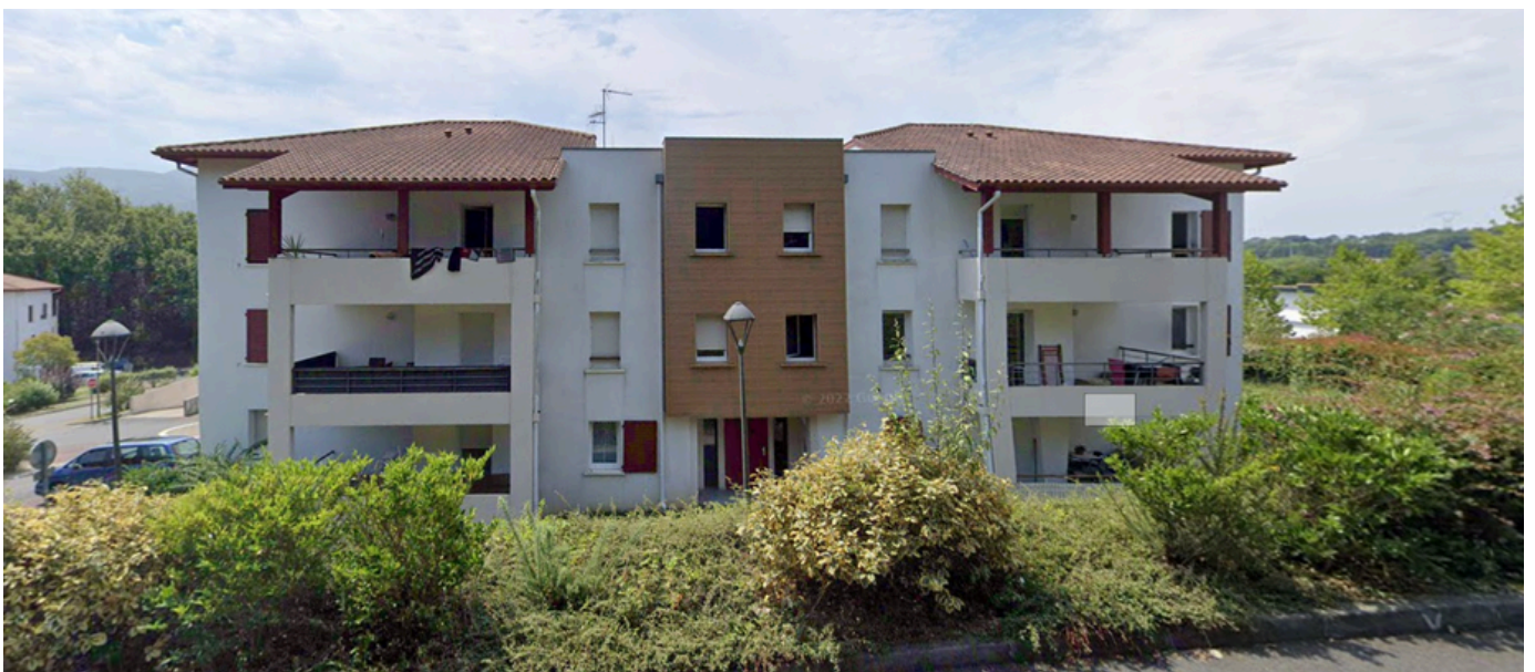
1 Rue Larre eder bidea - Résidence Larre Lore B2 11 - 64310 ASCAIN

IFCAF SARL - 20, Rue Cambon - 75001 PARIS et 1 Rue Larre eder bidea - Résidence Larre Lore B2 11 - 64310 ASCAIN SIRET : 819 519 455 00011 - NAF : 8559A - N° DÉCLARATION ACTIVITÉ : 11755475975 N° TVA INTRACOMMUNAUTAIRE : FR 63819519455 TÉLÉPHONE : 05 59 43 91 72 MAIL : CONTACT@IFCAF.FR